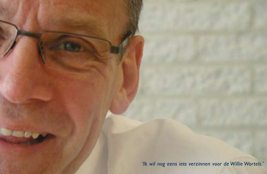
'Ik wil nog eens iets verzinnen voor de Willie Wortels.'