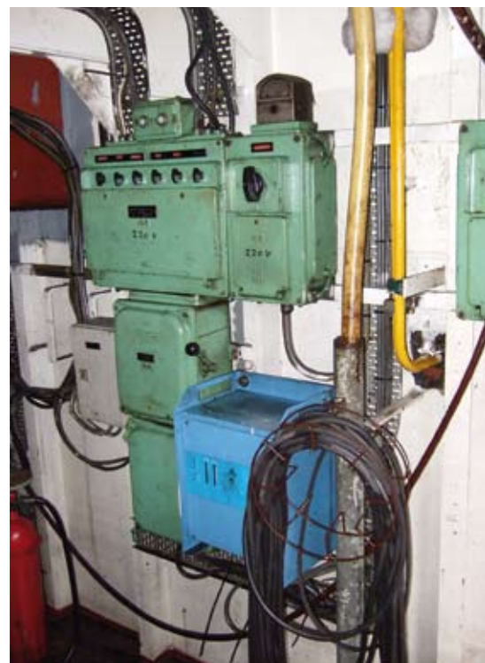
Van de hoofdschakelkasten moet een schema aan boord zijn, dat uw vaste elektriciens mag maken.

In de praktijk lijken de overgangsbepalingen, inclusief hardheidsclausule, nog mee te vallen. Van de door ons geïnspecteerde schepen heeft ongeveer tien