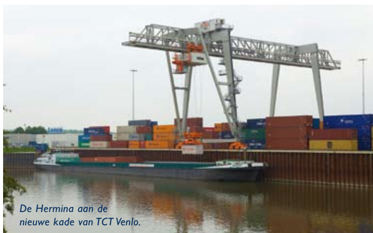
De Hermina aan de nieuwe kade van TCT Venlo.

Minister Eurlings van Verkeer en Waterstaat nam 3 juni in Venlo de bargeterminal van Trimodal Container Terminal Venlo (TCT Venlo) in gebruik. Aan een kade van 155 meter kan de terminal schepen tot 135 meter ontvangen en jaarlijks circa 200.000 teu overslaan. De terminal kreeg subsidies van V&W, de provincie en de EU. TCT Venlo exploiteert de bargeterminal en de nabijgelegen railterminal. Het bedrijf kan zo geïntegreerd spoor-, water- en wegvervoer aanbieden. TCT Venlo is een dochter van ECT in Rotterdam en maakt deel uit van een netwerk van inland terminals, dat fungeert als 'achtervang' van de zeeterminals van ECT in Rotterdam.