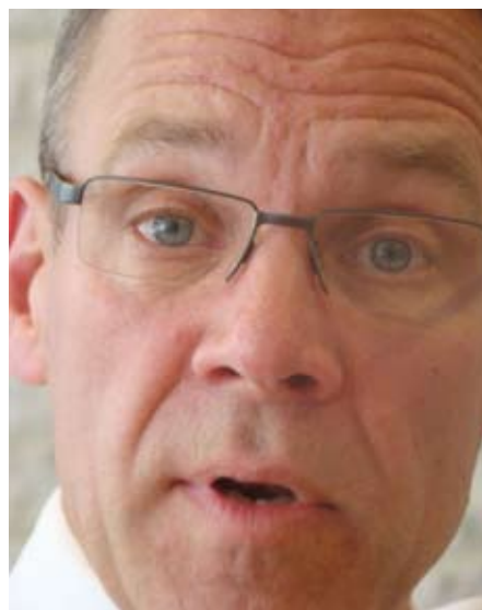
'Wat doe je in vredesnaam met één miljoen euro per jaar als je honderden retrofits wilt?'

Innovatie, expertise en educatie zijn vanouds de speerpunten van het EICB. Het wijst ondernemers met goede ideeën de weg in subsidieerland. Naast de Subsidieregeling Innovatie Binnenvaart (SIB) staan zo al negen andere subsidieregelingen in de EICB-folder. 'De helft van de omzet bestaat uit onze startprojecten en het SIB-geld daarvoor, de andere