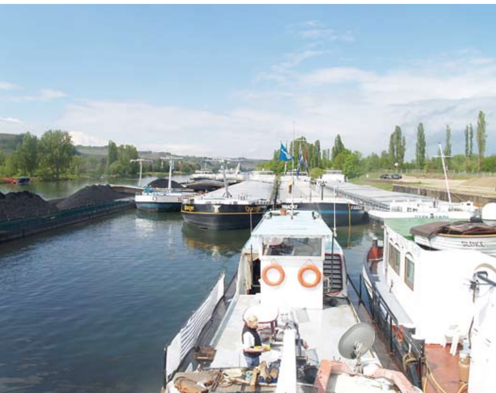
Bij acties is het van belang snel vast te leggen wie meedoet en wie er last van heeft.

De vrije concurrentie houdt de gemoederen in de binnenvaart nog steeds