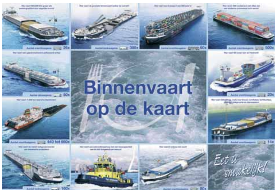
De placemat moet goed zijn voor 100.000 contactmomenten. (Ontwerp Idetif Beeldcreaties)

en mogelijkheden van binnenvaart letterlijk op de kaart te zetten: een dubbelzijdig bedrukte placemat waarop aan de voorzijde alle scheepsafbeeldingen te zien zijn en aan de achterzijde tekst en uitleg wordt gegeven.