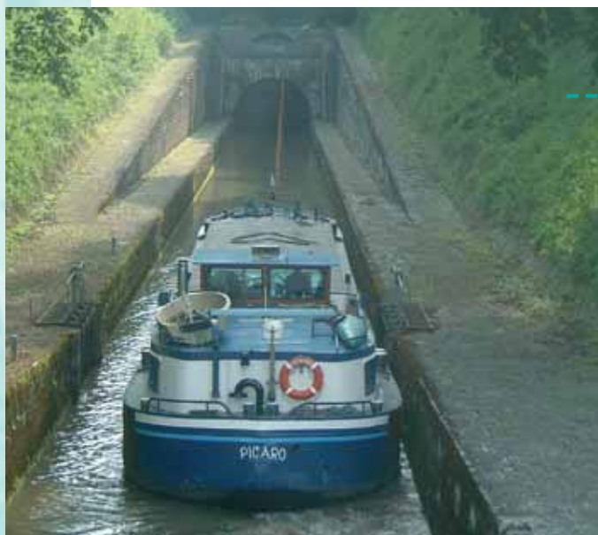
Foto voorpagina: De Picaro op het Franse Canal Latéral à la Marne